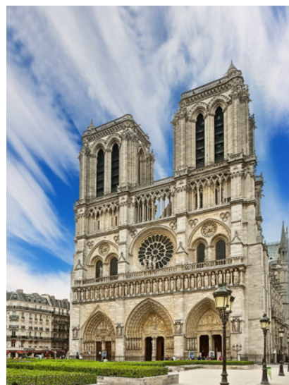
Katedra Notre Dame w Paryżu