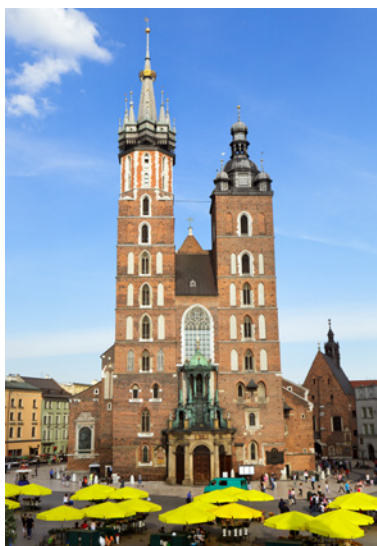
Kościół Mariacki w Krakowie

4 Określ, która budowla jest przykładem kompozycji symetrycznej, a która – asymetrycznej.