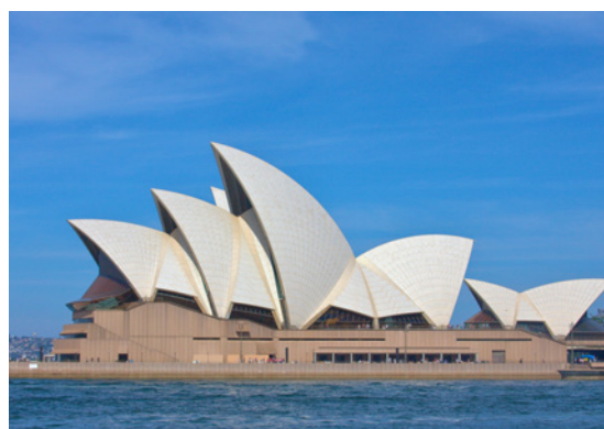
Opera w Sydney