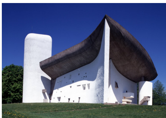
Kaplica Notre Dame du Haut w Ronchamp