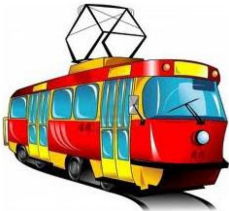
/ električka /