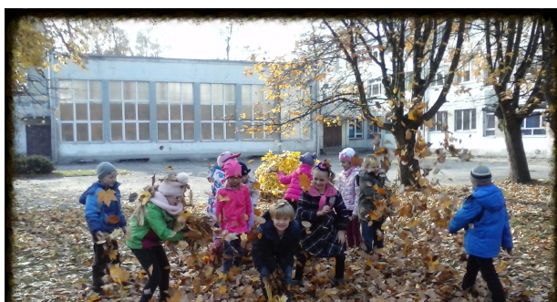
Pierwszaki w deszczu liści