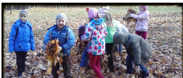
Ach te liście!