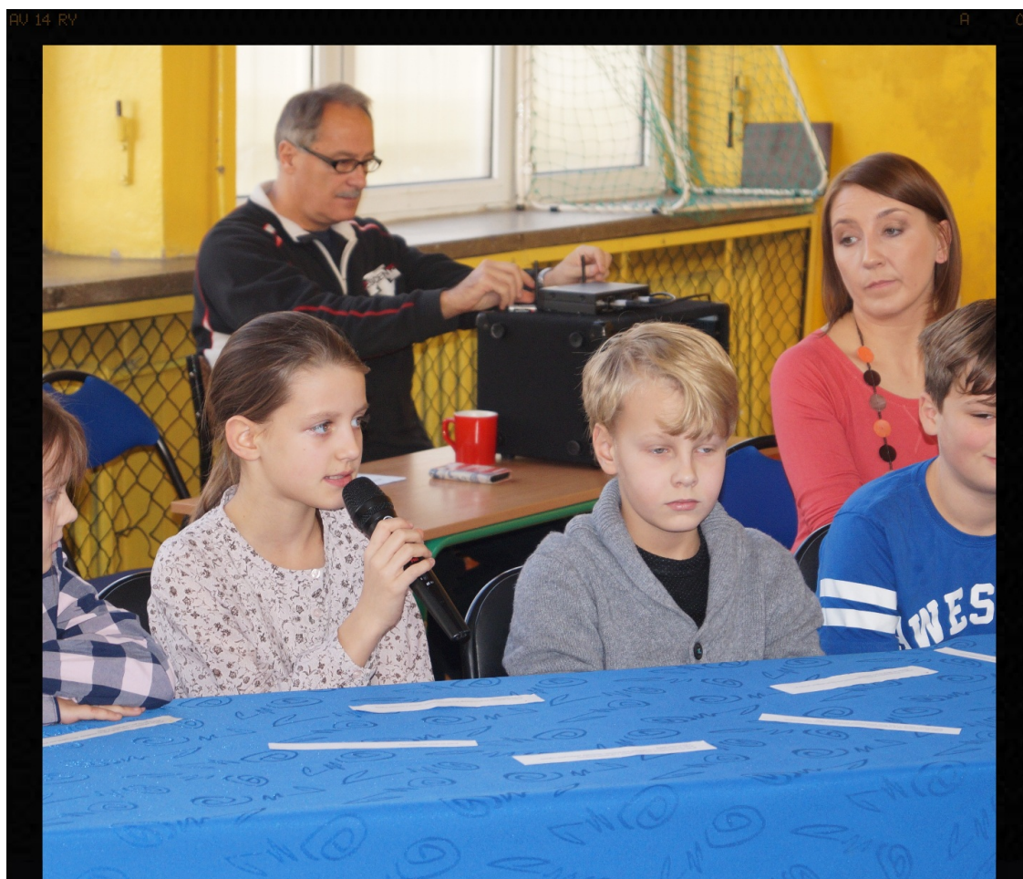
Jedna ze stron debaty