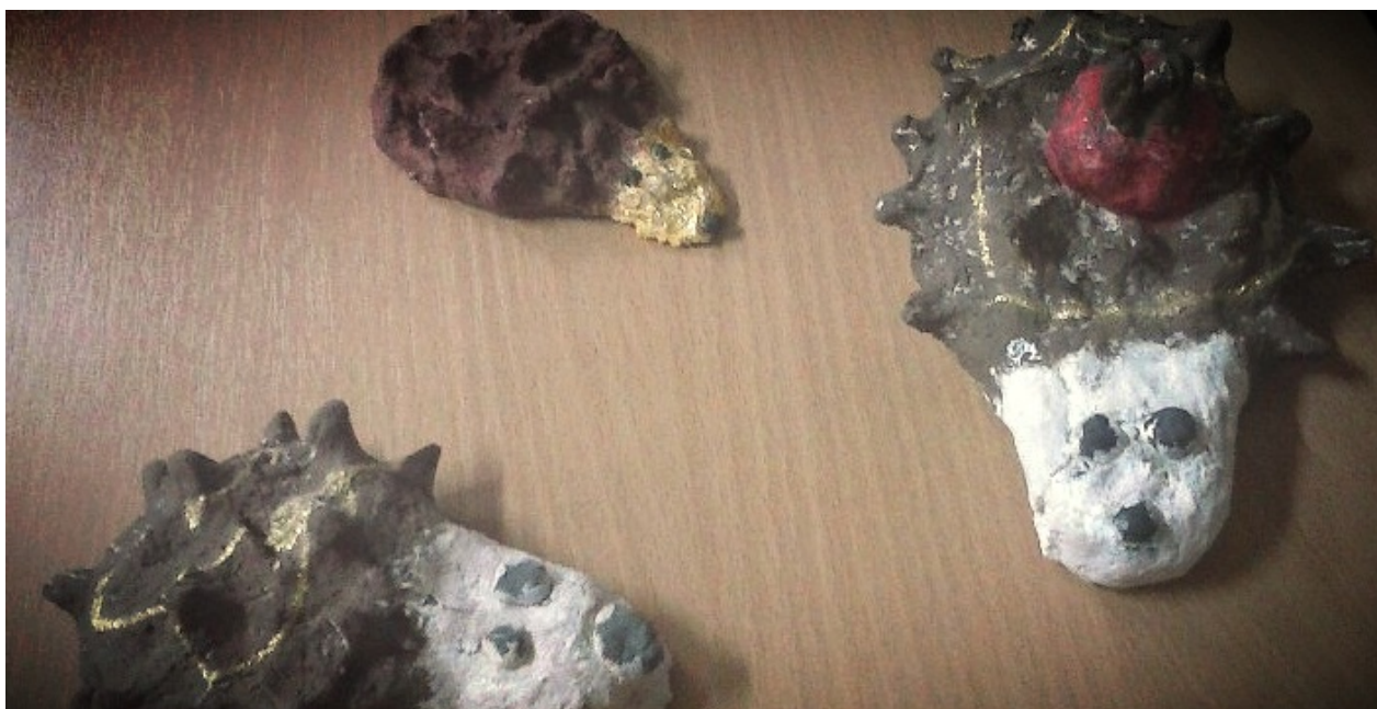
Jeże z masy solnej